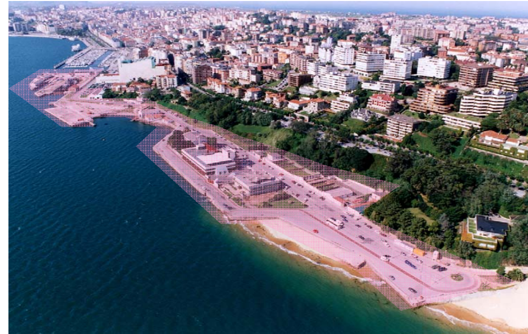
Futura centralidad de Santander

identidad de esta zona y la calidad de este espacio urbano. Contará además con zonas de juegos infantiles y aparcamientos de bicicletas.